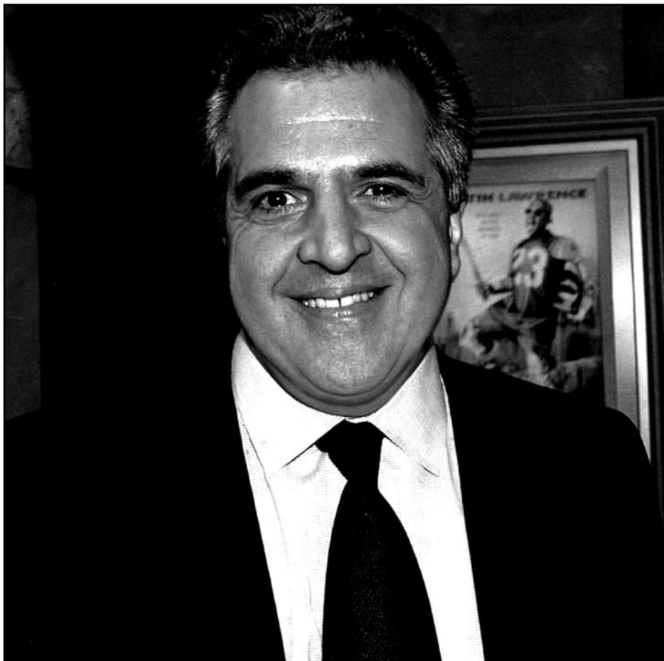
Εικόνα 1. Ο ισχυρότερος άνδρας του Hollywood κ. Jim Gianopolos Πρόεδρος και Διευθύνων Σύμβουλος της Fox Filmed Entertainment του μεγιστάνα Ρούπερτ Μέρντοχ.

Φωτογραφία από επίσκεψή του στο 48ο Κινηματογραφικό Φεστι-βάλ Θεσσαλονίκης σε Συνέντευξη που έδωσε στη Μαριάνθη Αλεξίου, έγκριτο δημοσιογράφο του περιοδικού Κτης Καθημερινής, Ιανουάριος 2008 (after permission).