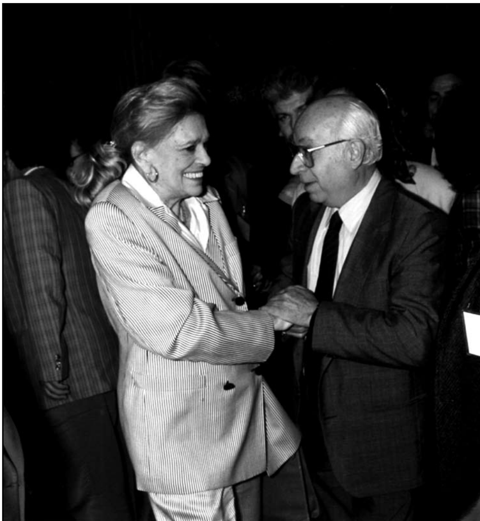
Εικόνα 2. Η Μελίνα Μερκούρη ως Υπουργός Πολιτισμού λίγο μετά από μια σύσκεψη – συνέδριο με τον Παιδοχειρουργό κ. Χρίστο Θ. Οικονομόπουλο τον οποίο εκτιμούσε για τις πολιτιστικές του δραστηριότητες και για την αγάπη του προς τη μητέρα και το παιδί.

ιδιωματισμούς, ώστε η διήγηση να γίνει περισσότερο αντιληπτή από το μεγάλο πλήθος του Αμερικανικού λαού που θα αποτελέσει για την αξιολογή αυτή ταινία τη μεγάλη αγορά.