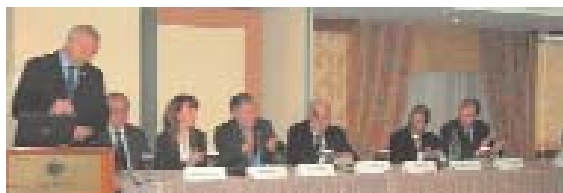
Το Προσωρινό Διοικητικό Συμβούλιο του Συλλόγου μας