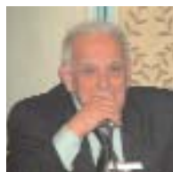
Πρόεδρος ΠΕΡΙΣΣΙΟΣ ΑΝΔΡΕΑΣ