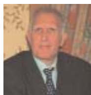
Γεν. Γραμματέας ΝΑΟΥΜ ΧΡΗΣΤΟΣ