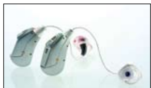
Εικόνα 2. Το πρώτο multimedia ακουστικό βαρηκοΐας 'TOP' της Audioservice, από την Earcare, για ενδοωτιαία ή οπισθωτιαία εφαρμογή.