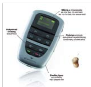
Εικόνα 1. Το επαναστατικό ακουστικό βοήθημα 'TOP' της Earcare προσφέρει απόλυτη ευκρίνεια ήχου ακόμα και σε δύσκολες ακουστικές συνθήκες.