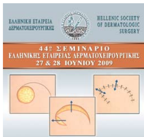
Εικόνα 1. Το εξώφυλλο του προγράμματος.