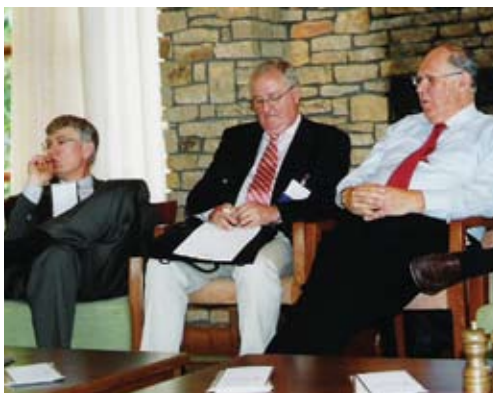
Ο πρόεδρος της Διεθνούς Εταιρείας Δερματοχειρουργικής (ISDS), κ. Perry Robins (στο κέντρο).

Ελπίζουμε στην προσφορά καλύτερης εκπαίδευσης στους νέους Δερματολόγους με live workshops, αν και υπάρχουν νομικά προβλήματα