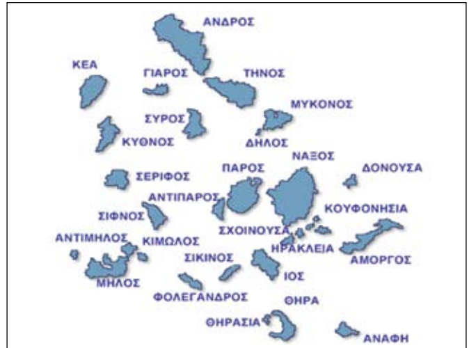
Εικόνα 3. Ο χάρτης των Κυκλάδων, στον οποίο τα νησιά είναι κυκλικά παραταγμένα έχοντας ως επίκεντρο τη νήσο Δήλο.

Ενώ κυριαρχούν τα γυναικεία αγαλματίδια, εντούτοις στην ποικιλία Πλαστρού περιλαμβάνεται και ικανός αριθμός ανδρόμορφων αγαλματιδίων. Τόσο τα ανδρικά όσο και τα γυναικεία ειδώλια συχνά έχουν προσεκτικά χαραγμένα χαρακτηριστικά προσώπου (εικόνα 4): κυρτή μύτη, στόμα, μάτια (φαίνονται ως τρύπες που έγιναν με τρυπάνι) και καμιά φορά έχουν χρησιμοποιηθεί ένθετες πέτρες στις οπές των οφθαλμών. Μερικές φορές, τέτοια αγαλματίδια φορούν ένα βραχύ σκούφο ή ένα απλό φεσόμορφο καπέλο χωρίς γείσο (στα ελληνικά λέγεται πόλιος) (Fitton p. 26). Οι βραχιόνες είναι διπλωμένοι στους αγκώνες και οι πήχεις αναπαύονται στην κοιλιά, ενώ τα σκέλη είναι διαχωρισμένα μεταξύ τους και οι άκροιοι πόδες είναι οριζόντιοι. Τα αυτιά είναι ακατέργαστα, σμιλεμένες μικρές συμπαγείς προσκολληθείσες στην κεφαλή, ελλειπτικού σχήματος, όπως το παράδειγμα του επονομαζόμενου «του Καλλιτέχνη Ντούμα» (Doumas master), στο οποίο διατηρείται μόνο το δεξιό πτερύγιό του αυτιού. Η κεφαλή εδώ είναι αμυγδαλόσχημη και υπάρχει μια ελαφρώς διογκωμένη κοιλιά, στην