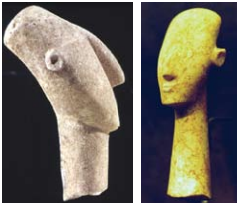
Εικόνα 1, 2. Κυκλαδικά αυτιά.