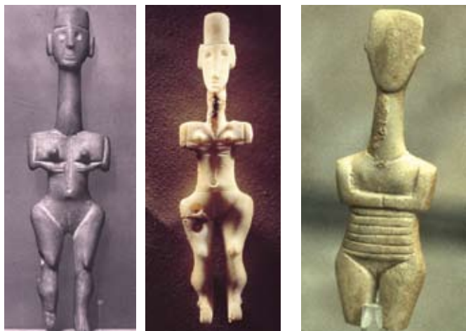
Εικόνα 6. Ειδώλια της Φάσας Πλαστηρά. A. Φάση Πλαστηρά (3000-2800 π.Χ.), MMA New York B. Καλλιτέχνης Μητροπολιτικού Μουσείου, 18,3cm. Φάση Πλαστηρά (2900 π.Χ.), MB-M Geneva.