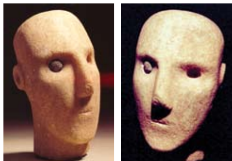
Εικόνα 8. Ειδώλιο της Φάσας Πλαστηρά ύψους 13,6cm (Καλλιτέχνης του Μουσείου Αθηνών) (2900-2800 π.Χ.), MB-M Geneva.

Στα ειδώλια της Φάσας Κέρου-Σύρου (περί το 2800/2700-2300/2200 π.Χ.) παρατηρείται η εισαγωγή του κλασικού διπλώματος των χεριών, το οποίο αναφέρεται ως ο κανονικός τύπος, διότι είναι το πιο συχνό εύρημα επί πέντε αιώνες, όπου διατηρήθηκαν ορισμένες συνηθισμένες μορφές ή τύποι εδωλίων, που έχουν μικρές μόνο τεχνοτροπικές διαφορές. Η Κέρος είναι μικρή νησίδα στις Κυκλάδες. Μεταξύ των ποικιλιών αυτής της φάσης, η ποικιλία Σπεδού (αρχαίο νεκροταφείο στη Νάξο) αποτελεί τη μεγαλύτερη ομάδα. Περιλαμβάνει γλυπτά μεγάλου εύρους μεγεθών, που ποικίλλουν από τα 10cm και μικρότερα