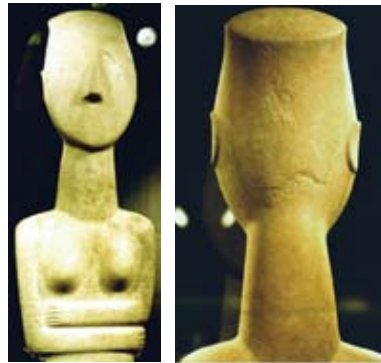
Εικόνα 12. Πλάγιες όψεις του ειδωλίου του της εικόνας 11, MCAGA Athens.