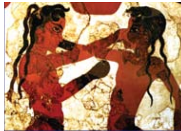
Εικόνα 21. Τοιχογραφία από το Ακρωτήρι της Θήρας που απεικονίζει αγόρια να πυγμαχούν χωρίς φόβο τραυματισμού των αυτιών τους που φέρουν σκουλαρίκια. (Akrotiri on Santorini, fresco from House B, before 1644 BC).