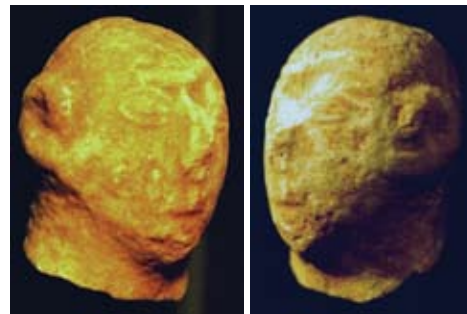
Εικόνα 19. Τοιχογραφίες από το Ακρωτήρι της Θήρας πριν από το 1644 π.Χ.. Στο λοβίο του αυτιού κρέμεται σκουληράκι (βλέπε κείμενο).

Ένα άλλο είδος Κυκλαδικής τέχνης που εμφανίστηκε από τη Μέση Εποχή του Χαλκού αποκαλύφθηκε στο Ακρωτήρι της Θήρας (Σαντορίνη), όπου η προϊστορική πόλη καταστράφηκε μετά από ηφαιστειακή έκρηξη περίπου το 1644 π.Χ. Στις ανασκαφές που έγιναν εκεί, οι αρχαιολόγοι βρήκαν τοιχογραφίες, μερικές από τις οποίες εκτίθενται στο Εθνικό Αρχαιολογικό Μουσείο των Αθηνών. Στις εικονιζόμενες εδώ (εικόνα 20) διακρίνεται μια άλλη προσέγγιση των αυτιών. Δηλαδή, παρατηρούμε το κυκλαδικό αυτί με ενώτιο (σκουληράκι). Στην εικόνα 20 στα αριστερά, μια νεαρή κόρη κρατάει ένα θυμιατήρι και θυμιατίζει. Το αριστερό αυτί της απεικονίζεται σαν ερωτηματικό και στολίζεται με ένα τεράστιο χρυσό σκουληράκι με ένα σταυρό στο κέντρο του. Στα δεξιά της εικονίζεται άλλη νεαρή κόρη: σ' ένα κροκόφυτο βραχώδες τοπίο συλλέγει τους στήμονες του άνθους ζαφορά. Φέρει ένα λεπτά επεξεργασμένο σκουληράκι που μοιάζει με το χρυσό σκουληράκι που βρέθηκε στις ανασκαφές του Θολωτού Τάφου ΙΙΙ των Μυκηνών και που πιθανόν κατασκευάστηκε από Κρήτες κοσμη- ➡