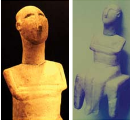
Εικόνα 16. Ειδώλια ενός κυνηγού-πολεμιστή (ύψος 20cm) και της γυναίκας συνοδού του (ύψος 15cm). Μετακανονικός τύπος (2400-2200 π.Χ.), MCAGA Athens (MCAGA 308 and 312).