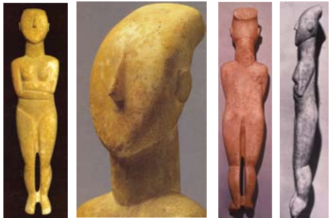
Εικόνα 14. Ειδώλιο παραλληλαγής Καψάλων από την Αμοργό κανονικού τύπου, ύψους 90cm (2600 π.Χ.), BLM Karlsruhe.

Ένα τρίτο παράδειγμα αυτού του μεγάλου ειδωλίου παραλληλαγής Σπεδού έχει ύψος 90cm και απεικονίζεται στην εικόνα 14. Υπολογίστηκε ότι έχει κατασκευαστεί περί το 2600 π.Χ. και βρίσκεται στο μουσείο Badisches Landesmuseum της Karlsruhe στη Γερμανία (Inv. 75/49). Πιθανολογείται ότι προέρχεται από τη νήσο Αμοργό. Διαφέρει από το ειδώλιο του Βρετανικού Μουσείου, διότι έχει μάλλον μικρότερη προσθιοπίσθια διάμετρο. Έτσι η κεφαλή μοιάζει με προσωπίδα. Τα αυτά έχουν σχήμα ελληιπτικής φέτας και είναι παρόμοια με του ειδωλίου του Βρετανικού Μουσείου. Τα «Κυκλαδικά ειδώλια», όπως έχει καθιερωθεί να ονομάζονται αυτά τα αγαλματίδια, ήταν εμφανώς δημοφιλή στην αρχαιότητα, όπως και σήμερα και γι' αυτό γινόταν εξαγωγή τους σε μεγάλες ποσότητες στην Κρήτη και σε αρκετή ποσότητα στην κυρίως Ελλάδα (Higgins p. 6). Ένα τέτοιο σημαντικό Κυκλαδικό ειδώλιο (εικόνα 15) βρέθηκε κοντά στον Τεκέ (κοντά στην Κνωσό). Πρόκειται για μια καθιστή γυναίκα ύψους 8,3cm που χρονολογείται από το 2400-2200 π.Χ.. Πιθανόν να ήταν στο δρό-