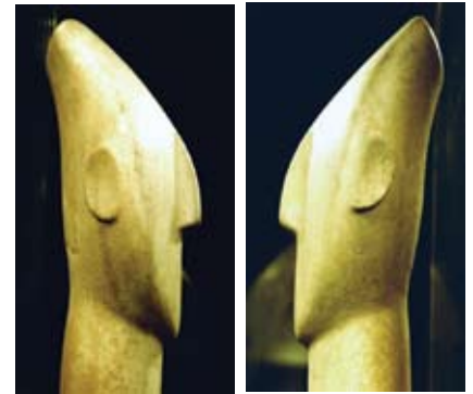
Εικόνα 13. Πολιτισμός Κέρου-Σύρου. Πρώιμη παραλληλαγή Σπεδού, ύψος Σπεδού 76,5cm (2700-2500 π.Χ.), BM London.

με έναν υπαινιγμό εκσκαφής (εικόνας 11, 12).