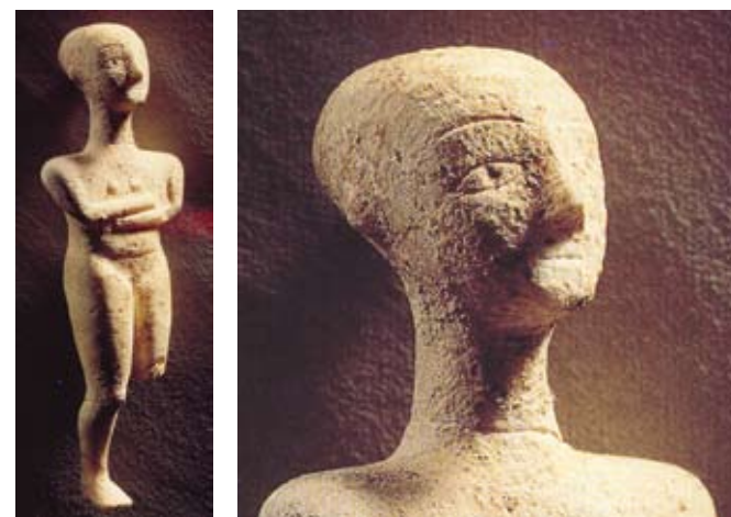
Εικόνα 10. Ειδώλιο ύψους 15,8cm, προ-κανονικού ύψους (2800 π.Χ.), MB-M Geneva.

μέχρι φυσικού μεγέθους περίπου. Το μεγαλύτερο σε μέγεθος Κυκλαδικό γλυπτό (ύψους 148cm) βρέθηκε στην Αμοργό και εκτίθεται στο Εθνικό Αρχαιολογικό Μουσείο Αθηνών. Δυστυχώς, η κεφαλή του γλυπτού δε φέρει αυτιά. Στο Μουσείο Κυκλαδικής και Αρχαίας Ελληνικής Τέχνης Ν.Π. Γουλιανδρή (Αθήνα) εκτίθεται τύπος αγάλματος γυναίκας της πρώιμης περιόδου Σπεδού (περί το 2700-2500 π.Χ.). Χει ύψος 140cm και φέρει όμορφα ελλειπτικά πτερύγια των αυτιών →