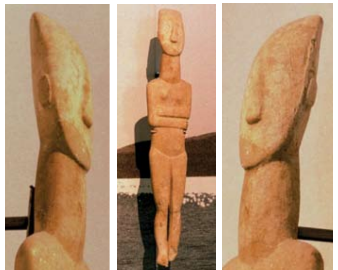
Εικόνα 15. Κυκλαδικό ειδώλιο από τον Τεκέ κοντά στην Κνωσό. Περίοδος Κέρου-Σύρου (2400-2200 π.Χ.) και ύψους 8,3cm, AM Heraklion Crete.