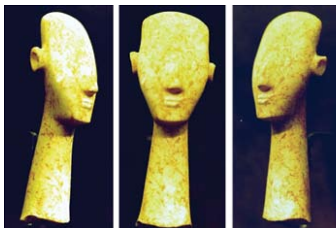
Εικόνα 9. Ειδώλιο με βοτσαλόσχημη κεφαλή με πολύ ψηλό λαιμό της Φάσας Πλαστηρά, ύψους 7cm με χωνοειδή πτερύγια των αυτιών ειδικής κομψότητας (3200-2800 π.Χ.) (MCAGA Athens, 342).