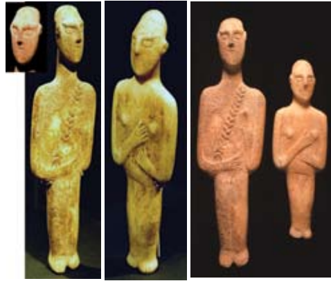
Εικόνα 17. Μολύβδινο ανδρικό ειδώλιο μετακανονικού τύπου και ύψους 7,5cm (2200-2000 π.Χ.), MCAGA Athens.

μο προς τους τάφους της Μεσσαράς, όπου έχουν βρεθεί με τις ανασκαφές πολλά άλλα Κυκλαδικά ειδώλια. Οι θέσεις των οφθαλμικών κόγχων και των αυτιών μοιάζουν μάλλον φυσιολογικά. Παρά τούτο, το αυτί μοιάζει με ελαφρώς ελλειπτική φέτα με μίαν ανώμαλη εκκαφή που υπονοεί την κογχική κοιλότητα (cavum conchae), όπως και σε πολλά από τα προαναφερθέντα παραπάνω παραδείγματα αυτιών (Αρχαιολογικό Μουσείο Ηρακλείου, 287).