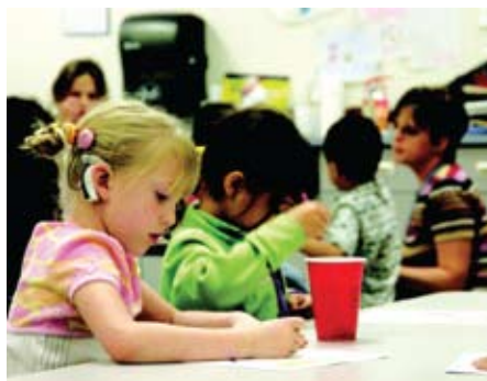
Εικόνα 3. Ανήλικος χρήστης κοχλιακού.