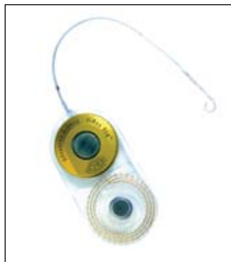
Εικόνα 1. Εμφύτευμα Advanced Bionics.

Οι ενδιαφερόμενοι μπορούν ακόμα να κάνουν από το σπίτι τους on-line μια απλή δοκιμή ακοής στην διεύθυνση www.akoh.gr .