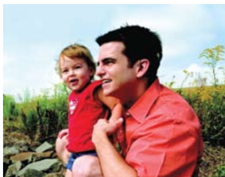
Εικόνα 4. Ενήλικος χρήστης κοχλιακού.