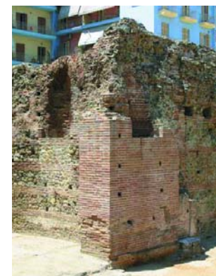
Εικόνα 3. Το παλάτι του Γαλιέρου.