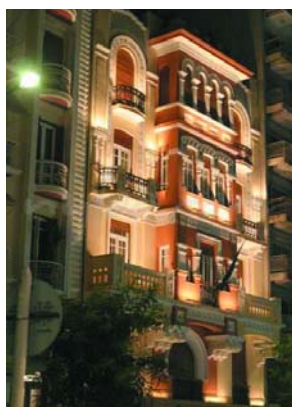
Εικόνα 4. Κτίριο αραβικής επιρροής.

Με το πέρασμα των αιώνων έχει ζήσει ιστορικές αλλαγές, πολέμους και κατα-