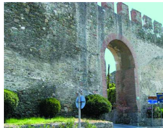
Εικόνα 10. Είσοδος στο κάστρο.