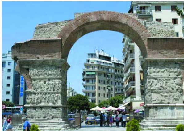
Εικόνα 9. Η Αψίδα του Γαλλέριου ή Καμάρα.