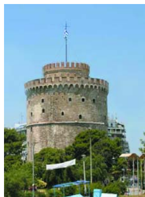
Εικόνα 1. Ο μεσαιωνικός Λευκός Πύργος.

Στην αίθουσα «Αμφιτρύων Ι» παρουσιάστηκαν ελεύθερες ανακοινώσεις που αφορού-