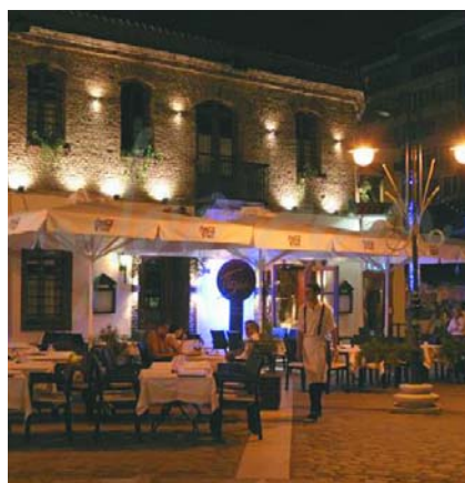
Εικόνα 6. Η περιοχή Λαδάδικα.