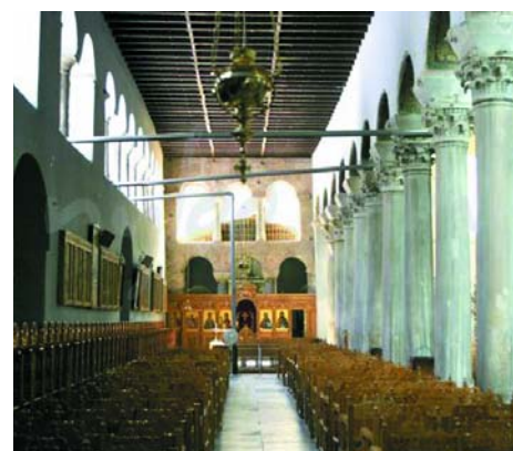
Εικόνα 7. Η βυζαντινή εκκλησία Παναγία Αχειροποιίτος. ➔