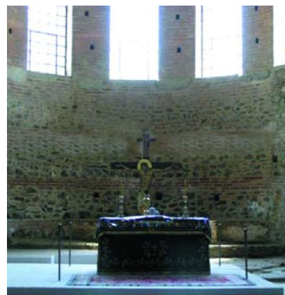
Εικόνα 2. Η Ποτόνια.