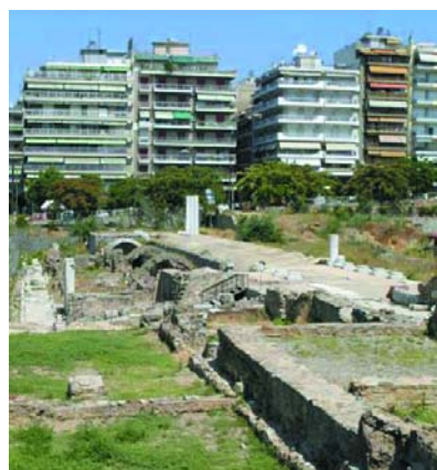
Εικόνα 8. Μέρος της Ρωμαϊκής Αγοράς.

Και βέβαια υπάρχουν και τα Λαδάδικα. Η περιοχή Λαδάδικα, περίπου 200 μέτρα ανατολικά από την πλατεία Αριστοτέλους, ήταν το εμπορικό και βιομηχανικό κέντρο της πόλης για ένα μεγάλο μέρος του 20ού αιώνα. Η περιοχή παρήκμασε και εξελίχθηκε σε κακόφημη συνοικία. Στις αρχές του 1990 τα περισσότερα από τα παραδοσιακά βιομηχανικά οικοδομήματα ανακαινίστηκαν και μετατράπηκαν σε δημοφιλή εστιατόρια, καφέ και κλαμπς. Το Βυζαντινό