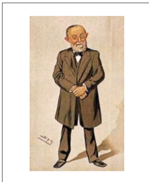
Καρικατούρα του Rudolf Virchow. Λιθογραφία του Sir Leslie Ward (1851-1922) Από τις σελίδες του περιοδικού Vanity Fair (19ος αιώνας). Δημοσιεύθηκε επίσης στο βιβλίο « Cellular Pathology », [London], Vincent Brooks, Day & Son, Lith., 1893.

Οι φιλοσοφίες του Kant και του Hegel διαμόρφωναν τότε τις συνειδήσεις του πολιτικού κόσμου στη Γερμανία. Σύμφωνα με το πρώτο από τα παραπάνω φιλοσοφικά συστήματα, το Κράτος εμφανίζεται σαν ο ακρογωνιαίος λίθος του πολιτισμού, ενώ σύμφωνα με το δεύτερο, το Κράτος είναι η ατμομηχανή της Ιστορίας. Αυτές οι ιδέες συνιστούν το πνευματικό περιβάλλον μέσα στο οποίο έζησε ο Virchow. Έτσι, δε θα αρκεσθεί να προσδιορίσει την ιατρική σαν κοινωνική επιστήμη, αλλά θα φθάσει μέχρι το σημείο να γράψει ότι ακόμη και η πολιτική δεν είναι παρά μια μεγάλη ιατρική: Die Medicin ist eine sociale Wissenschaft, und die Politik ist weiter nichts, als die Medicin im Grossen . Φράση φορτωμένη με νοήματα και με συνέπειες για μια χώρα που