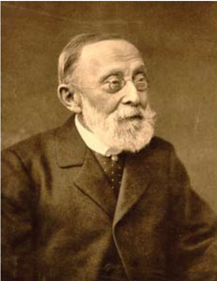
Ο Rudolf Virchow σε προβεβηκυία ηλικία.