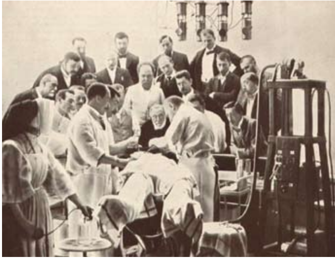
1899: Ο Virchow παρακολουθεί χειρουργική επέμβαση σε μια κλινική, στο Παρίσι.

στημονικά κέντρα, ακόμη και στην Ιαπωνία και στη Ρωσία. Ποτέ δεν αρρώστησε σοβαρά, αλλήλ στα 1902 τον περίμενε ένα θανατηφόρο ατύχημα. Καθώς ήταν ιδιαίτερα δραστήριος και σε διαρκή κίνηση, έπεσε από ένα κινούμενο τραμ και υπέστη κάταγμα ισχίου. Αναγκάστηκε σε μια