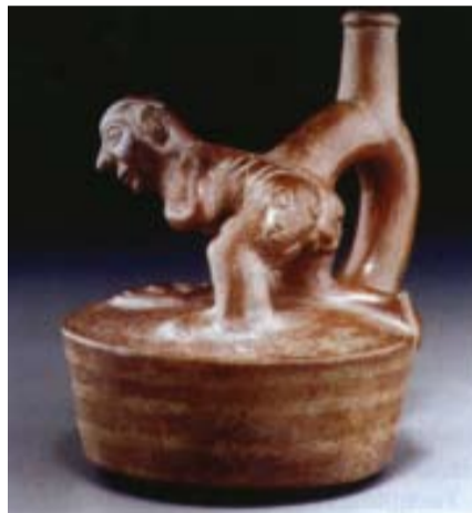
Εικόνα 1. Ασθενής με γυμνούς γλουτούς γεμάτους βλάβες από επίπεδα κονδυλώματα σύφιλης.

Πιθανότατα πρόκειται για περίπτωση κνίδωσης.