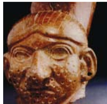
Εικόνα 4. Φλυκταινώδης ακμή