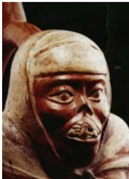
Εικόνα 3. Κεραμικό αντικείμενο του πολιτισμού Moche, που απεικονίζει λείσμανίαση.