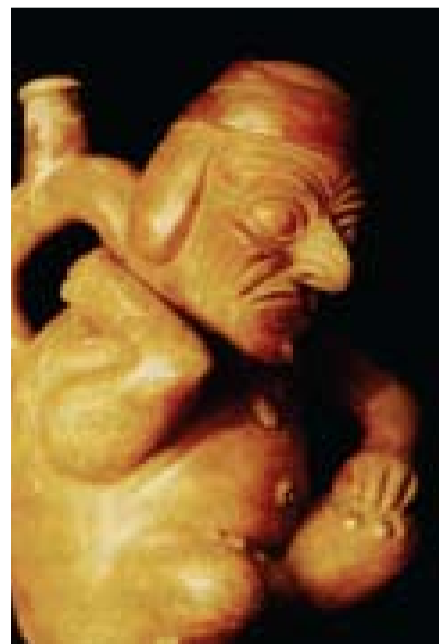
Εικόνα 6. Πιθανή κνίδωση