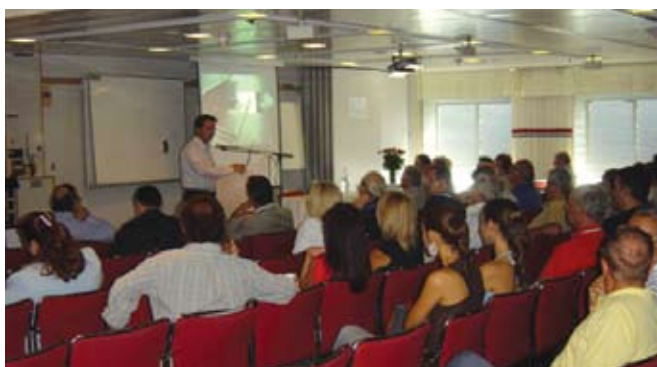
Εικόνα 3. Αίθουσα ομιλιών.