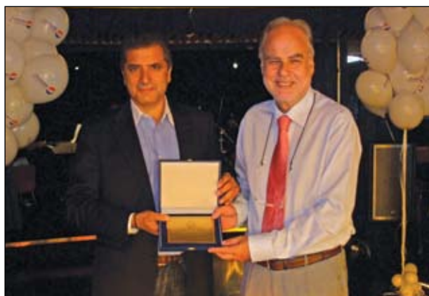
Εικόνα 1. Ο επίτιμος πρόεδρος Ε.Ε.Ι.Α. Γ. Πατούλης απονέμει στον πρύτανη καθηγητή κ. Χ. Κίττα τιμητική πλακέτα.

Τ ην κορυφαία αυτή επιστημονική εκδήλωση του Ε.Ε.Ι.Α. λάμπρυνε με την παρουσία και τη συμμετοχή του ο Πρύτανης του Πανεπιστημίου Αθηνών καθηγητής κ. Χρίστος Κίττας, η γραπτή εισήγηση του οποίου «Β-κατενίνη και καρκίνος» βρίσκεται στον τόμο των πρακτικών του σεμιναρίου, ο οποίος αποτελείται από 265 σελίδες και περιέχει όλες τις εισηγήσεις των ομιλητών.