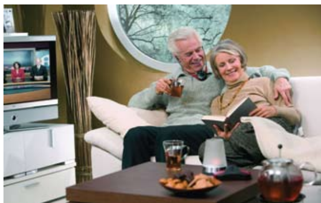
Τα νέα ακουστικά τηλεόρασης " Sennheiser SET 820 " από την earcare προσφέρουν υψηλή στερεοφωνική απόδοση ήχου.